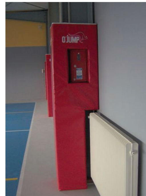
Corte a medida

Fijación a la pared mediante banda de unión Una banda se fija a la pared y la otra está cosida en la protección