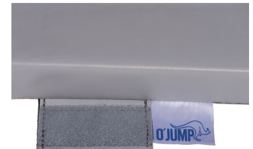
Tira de cohesión