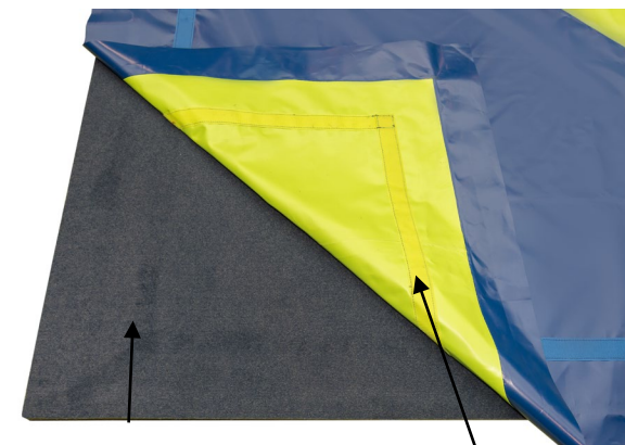
Subcapa de pista