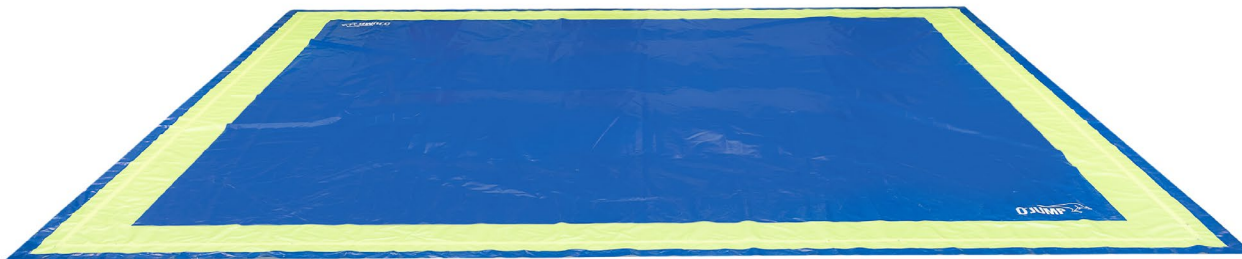
2- Cara de judo