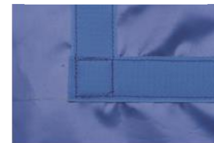
Sous couche mousse