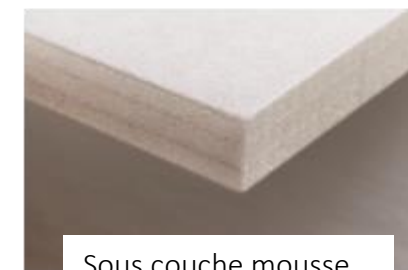
Sous couche mousse

Nous consulter pour les tapis ou bâches sur mesure, cadre de bordage, fixation par œillets